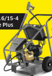
HD 16/15-4 Cage Plus

Ersparnis bis ZU € 1.300,- gegenüber UPE