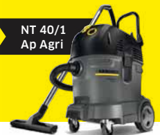
NT 40/1 Ap Agri