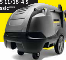
HDS 11/18-4 S Classic**

Ersparnis bis ZU € 1.900,- gegenüber UPE