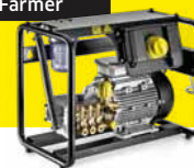
HD 9/18-4 Cage Farmer