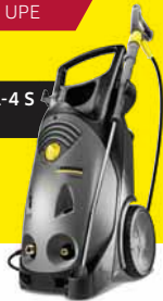
HD 10/21-4 S Plus

Ersparnis bis ZU € 1.900,- gegenüber UPE